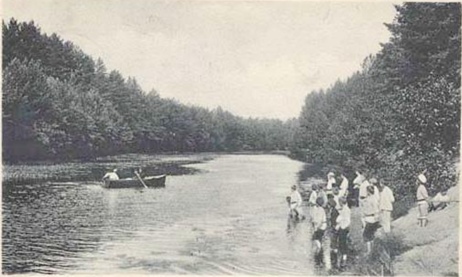
Окрестности Сестрорецкого Курорта.—На р. Сестре.

Окрестности Сестрорецкого Курорта. На реке Сестре. 1903 г.