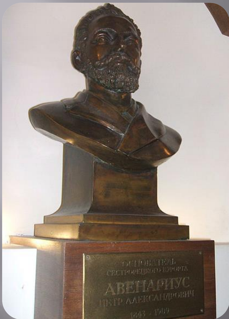
Бюст находится в фойе лечебного корпуса.

Санаторий был основан 19 июня 1898 г., открыт 23 июня 1900 г. Идея строительства отдаётся П. А. Авенариусу в целях увеличения доходов Общества Приморской С.-Петербургско-Сестрорецкой железной дороги.