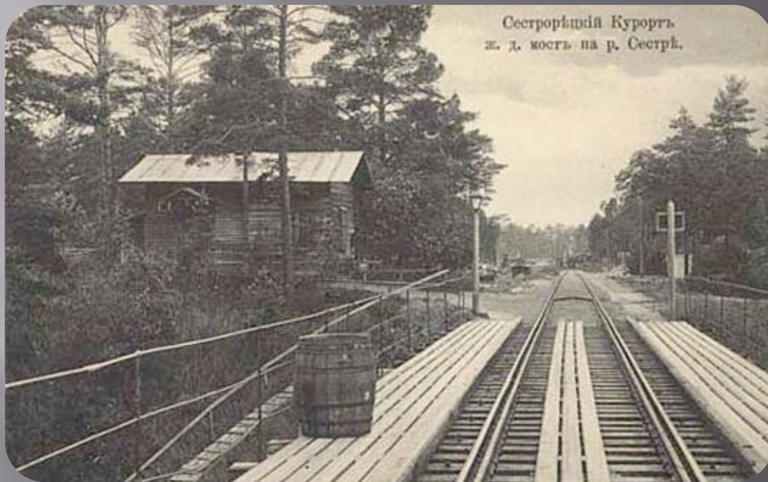
Сестрорецкій Курортъ. ж. д. мостъ на р. Сестрѣ.