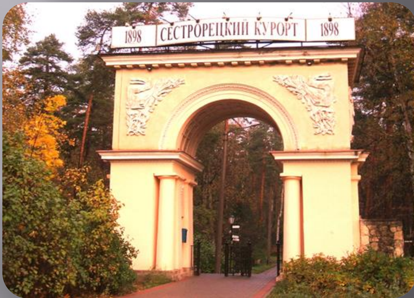
Парадные ворота (арх.Кирхоглани, 1953-70 г.)