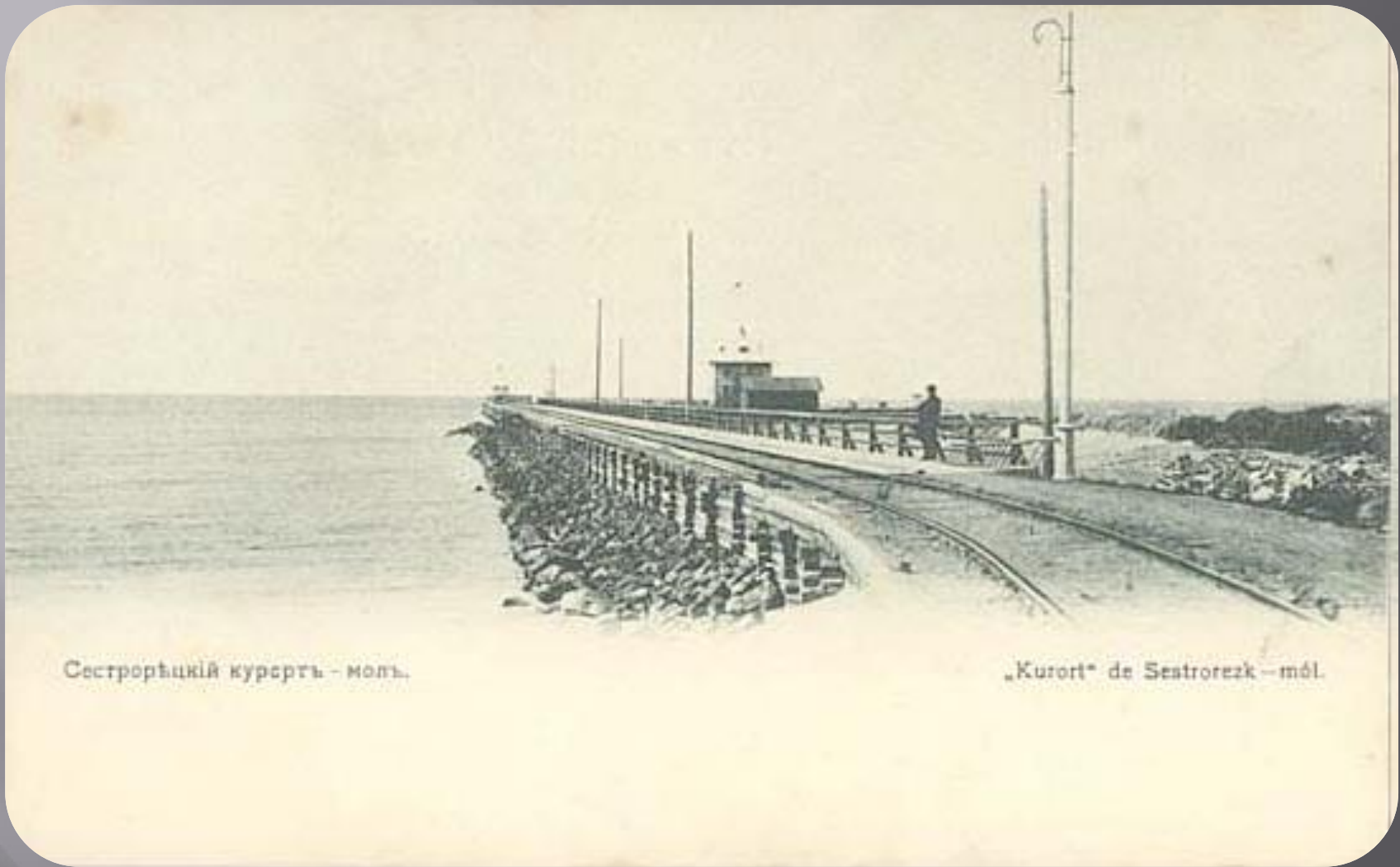
Сестрорѣцкій курортъ - моль.