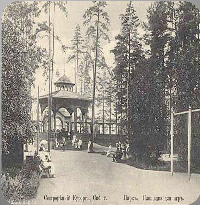
Сестрорецкий Курортъ, Сиб. г. Паркъ. Площадка для игръ.