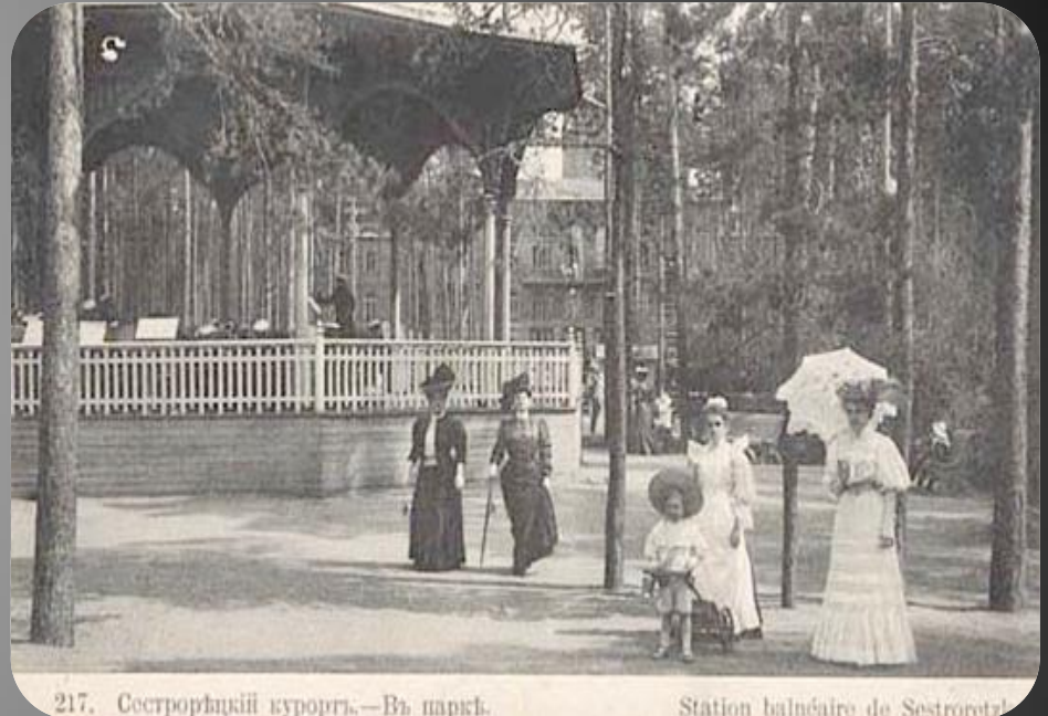
217. Сестрорецкий курортъ.—Въ паркѣ.