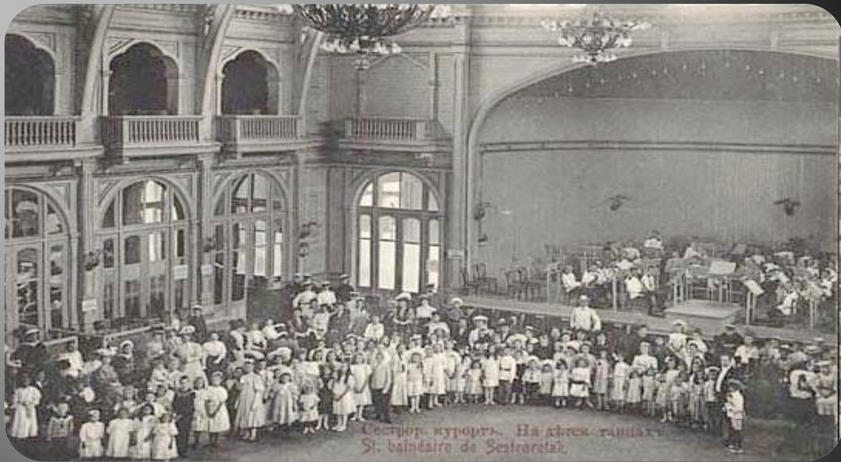
Сестрор. курорт). На дѣтск. танцахъ St. balnéaire de Sestrorski.

Деревянное здание курзала было построено по проекту архитектора Г.Я. Леви. В центре здания располагался концертный зал высотой 14.3 метра, рассчитанный на 1700 человек. Зал освещали три огромные электрические люстры.