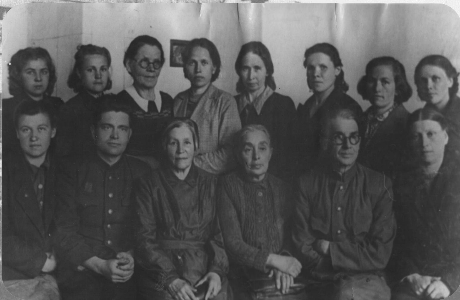
Школа №433 (бывшая №6)