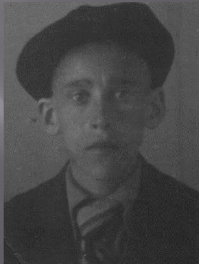
Во время блокады.