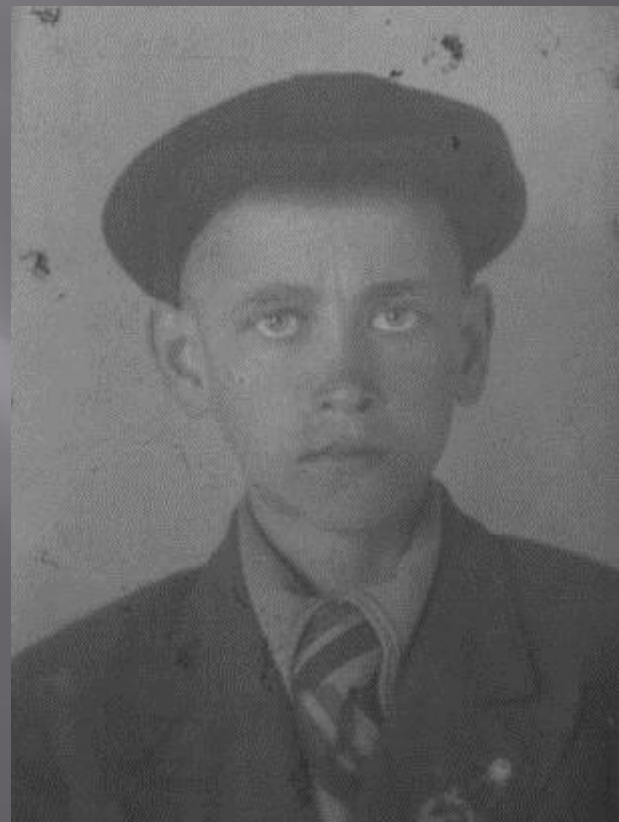
Во время блокады.